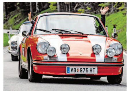
Beim Gaisbergrennen werden 75 Jahre Porsche gefeiert.