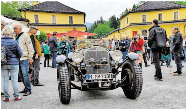
Die Fahrzeugabnahme vor dem Schloss Hellbrunn.