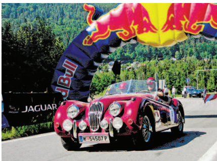
Der Start auf den Gaisberg erfolgt traditionell in Guggenthal.

Erstmals zur Sache geht es anschließend bei der ersten Wertungsfahrt des diesjährigen Gaisbergrennens, dem Stadt Grand Prix ab 15 Uhr. Wobei der Begriff „Rennen“ nur aus historischen Gründen verwendet wird: Sowohl auf der rund 1,8 Kilometer langen Strecke zwischen Staats- und Karolinenbrücke als auch bei den folgenden Wertungsfahrten gilt es, möglichst genau ein moderates Durchschnittstempo zu erreichen. Automobilbegeisterte Besucherinnen und Besucher kommen in jedem Fall voll auf ihre Kosten.